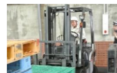
フォークリフト操作(福岡)