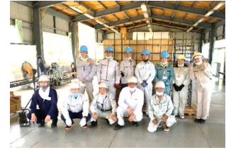
鉄筋組立完了(兵庫)

開設者 一般財団法人 建設業振興基金 各地主催 職業訓練法人 全国建設産業教育訓練協会富士教育訓練センター 職業訓練法人 近畿建設技能研修協会三田建設技能研修センター 一般社団法人 福岡県建設専門工事業団体連合会 募集人数 各会場 20名 (先着受付順) 対象者 教諭